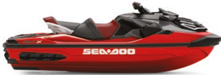
● NOVEDAD Rojo ardiente premium