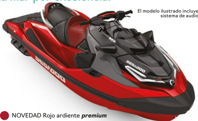
El modelo ilustrado incluye sistema de audio