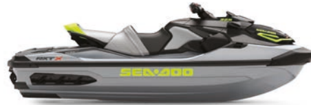
● NOVEDAD Hielo metalizado / Verde Manta