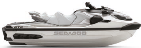
○ NOVEDAD Blanco perla prémium