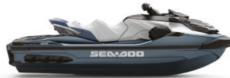
● Azul abismo