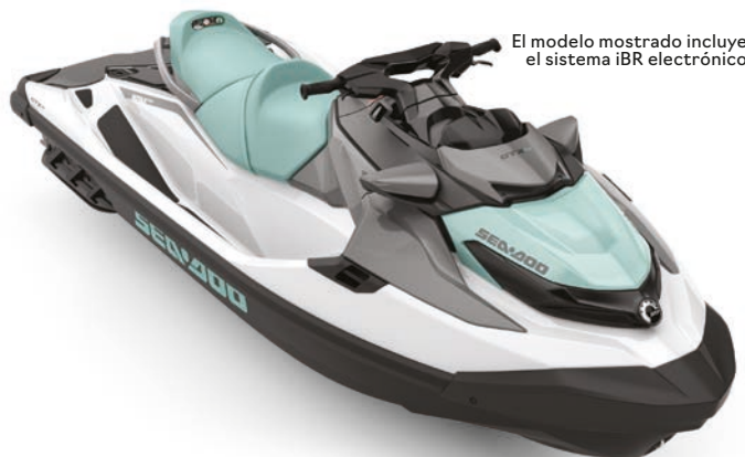
El modelo mostrado incluye el sistema iBR electrónico